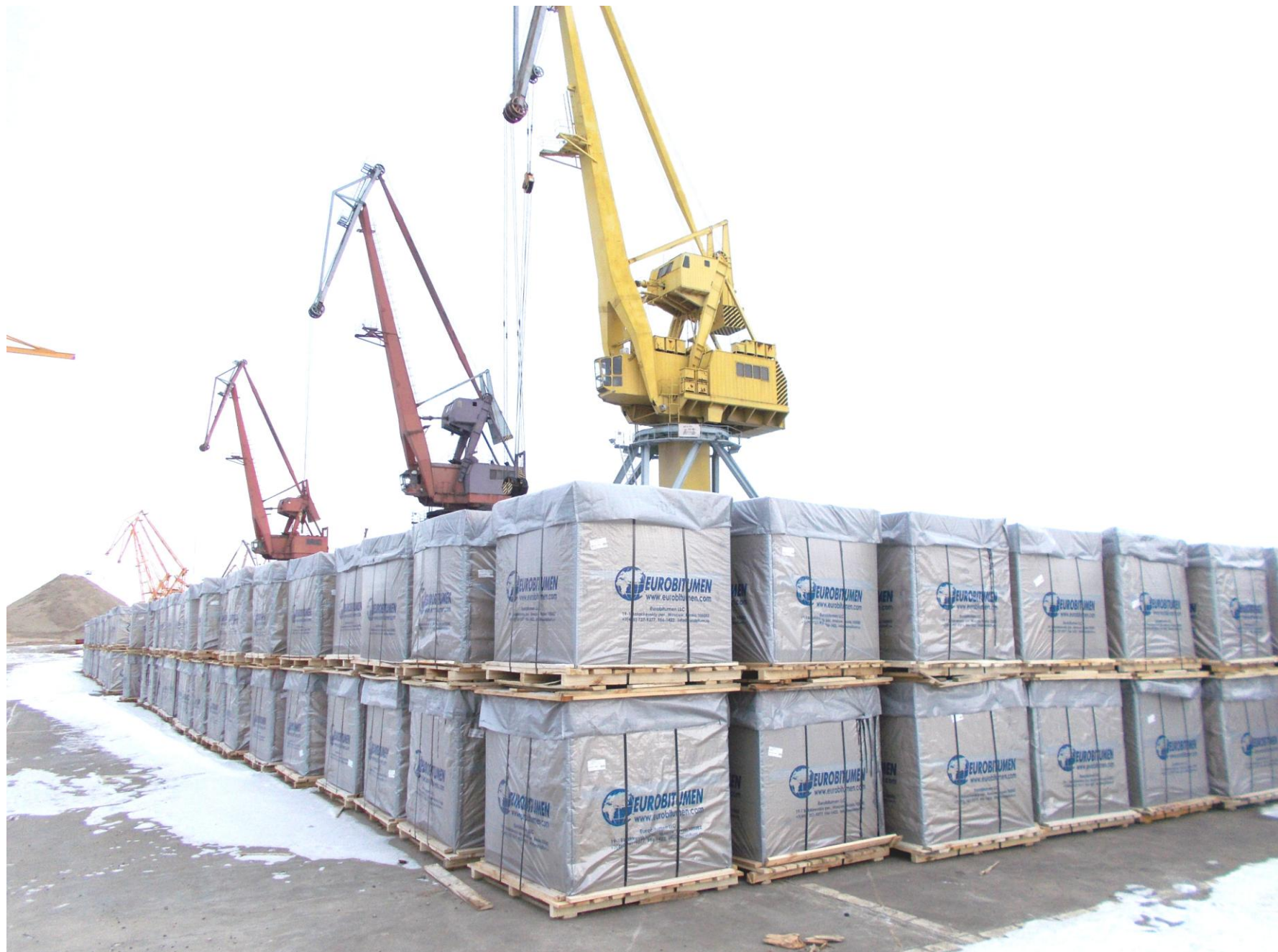
Накопление битума на площадке для дальнейшей загрузки в контейнеры