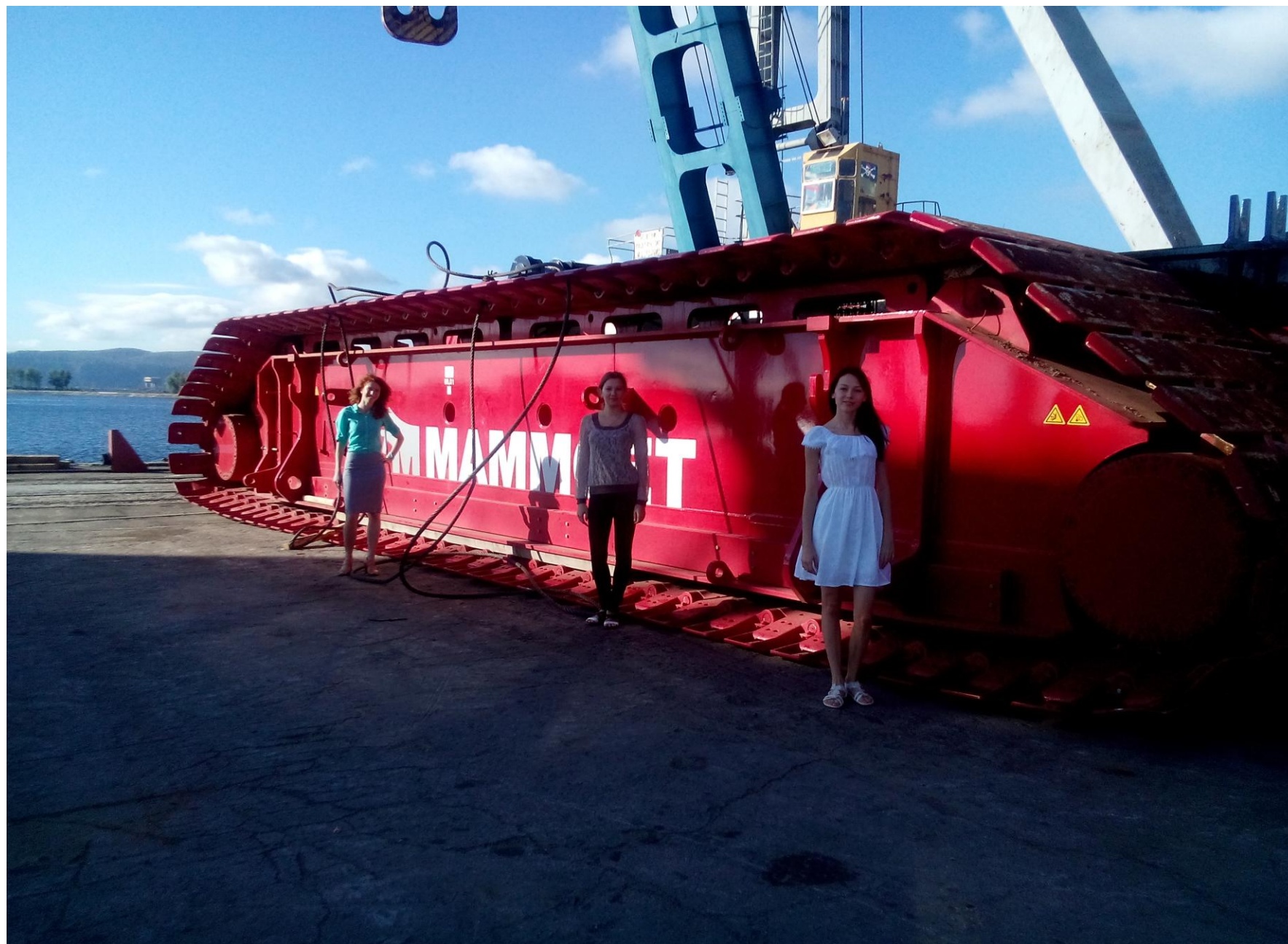
Подготовка оборудования для погрузки в судно стационарным краном г/п 100 тн