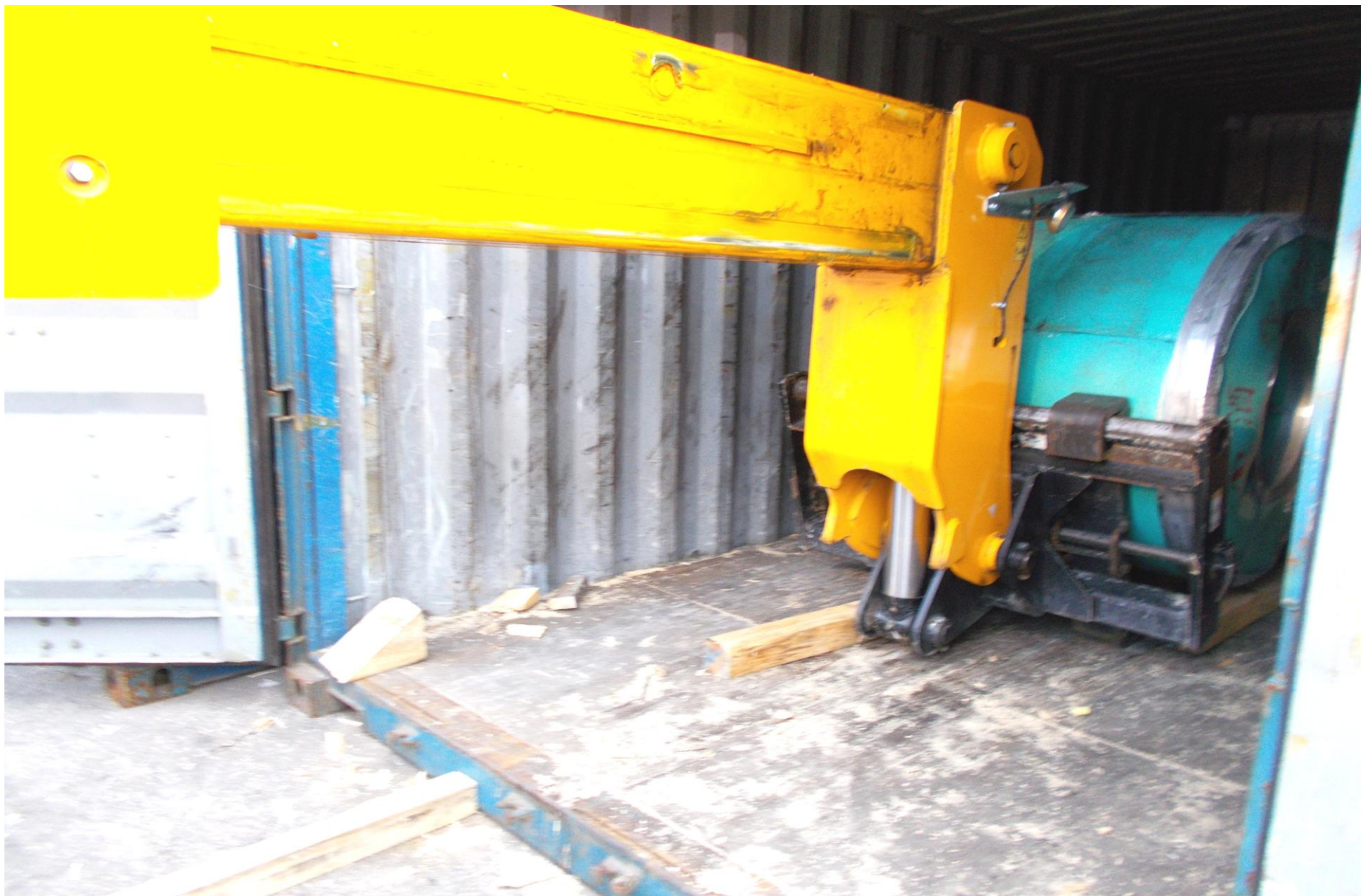
Работа погрузчика г/п 7 тн при выгрузке рулонов стали из контейнеров