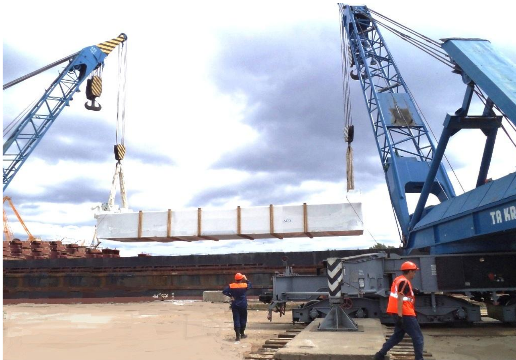
ВЫГРУЗКА КРУПНОГАБАРИТНОГО ГРУЗА ИЗ СУДНА ДВУМЯ ВОССТАНОВИТЕЛЬНЫМИ КРАНАМИ ЕДК-2000