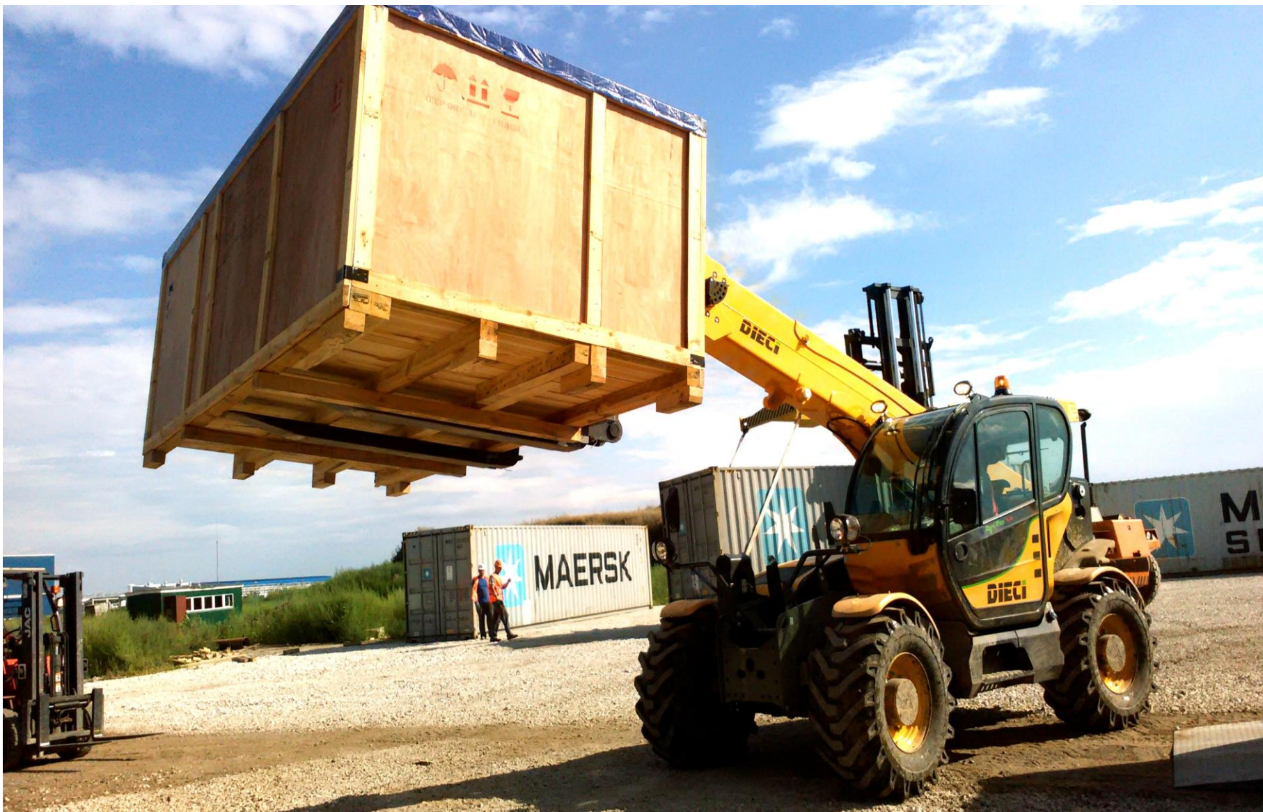
Работа погрузчика г/п 7 тн при выгрузке оборудования из контейнеров