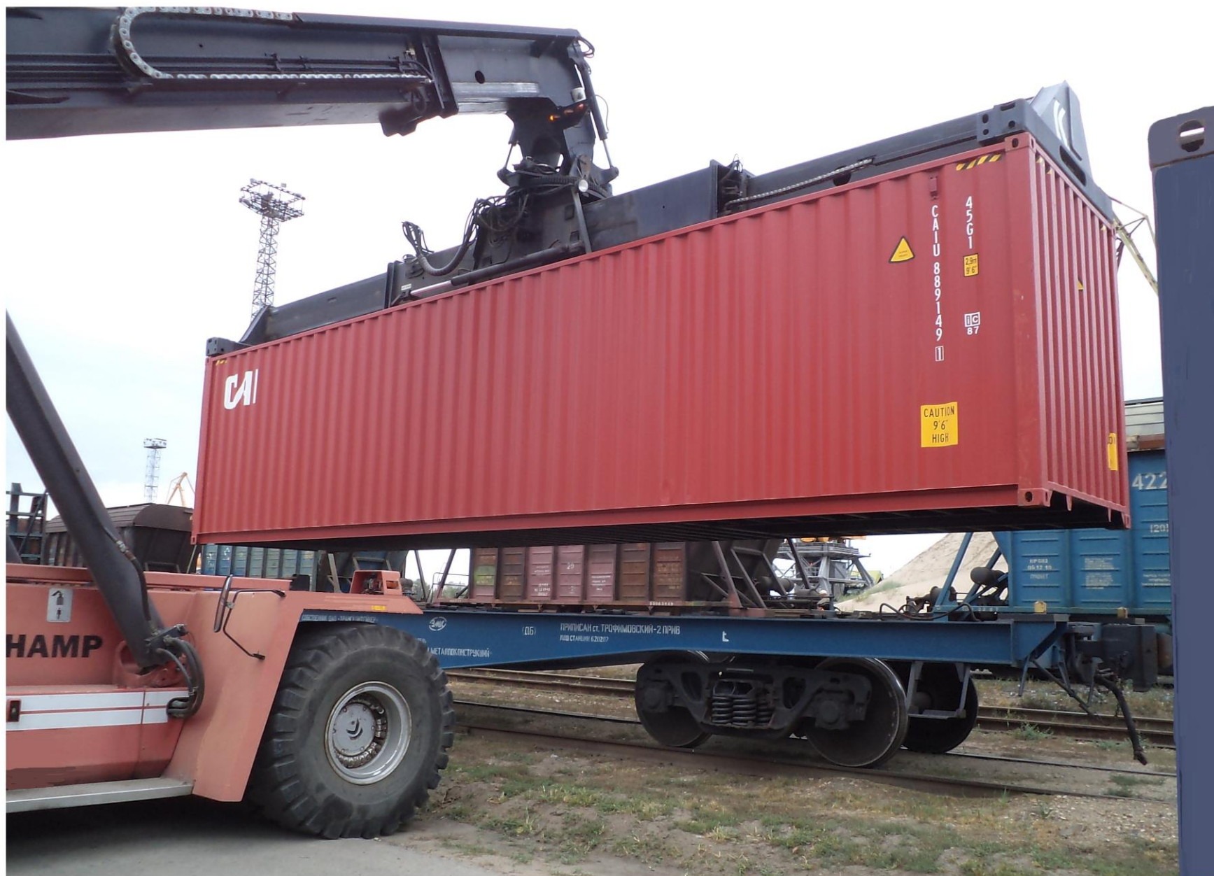
Контейнерный Погрузчик "Кальмар" г/п 45 т. Загрузка контейнерного поезда